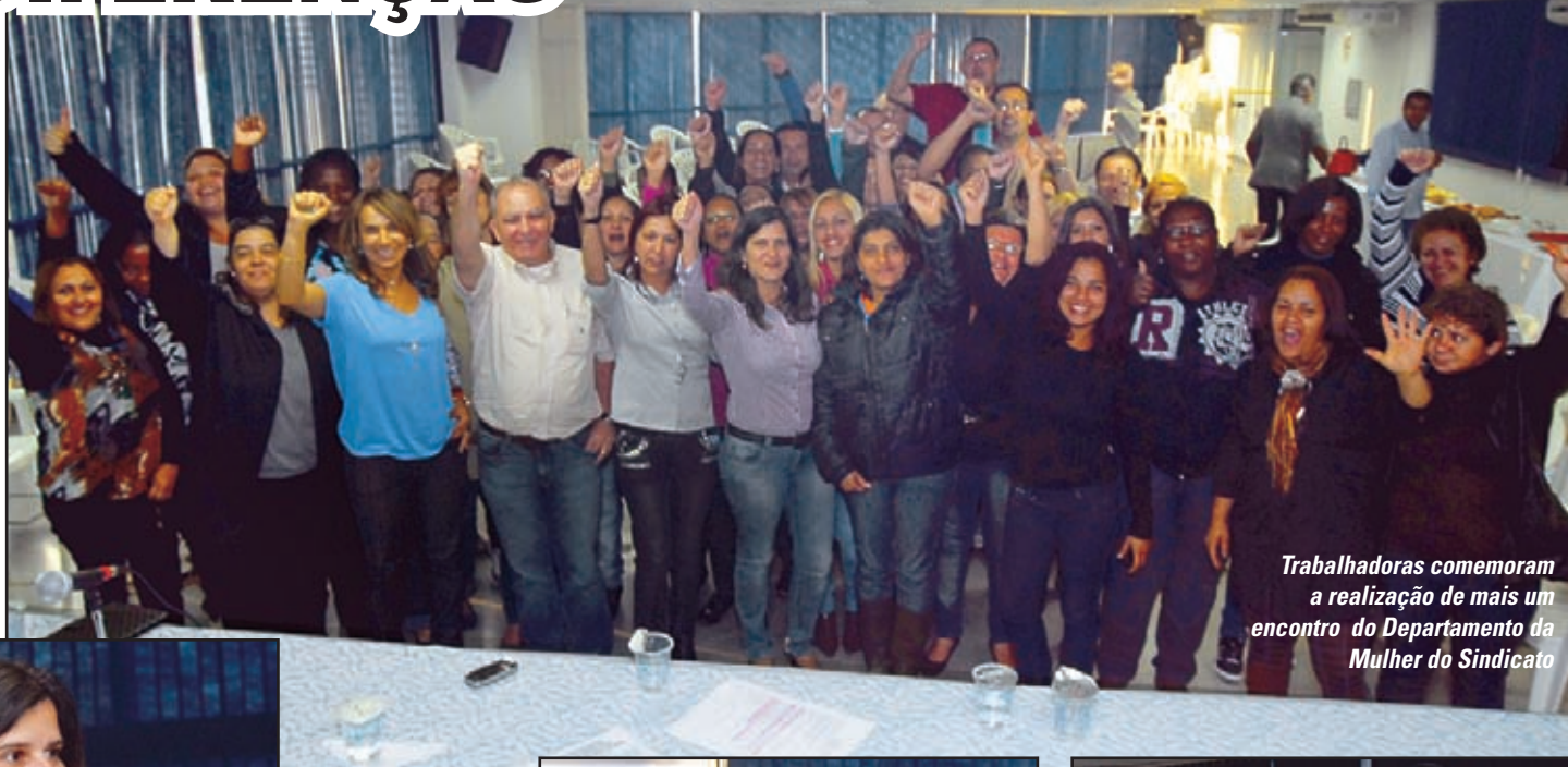
Trabalhadoras comemoram a realização de mais um encontro do Departamento da Mulher do Sindicato