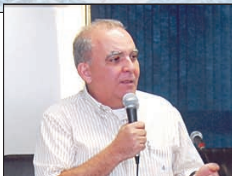
Miguel Torres: as mulheres precisam avançar nas suas lutas