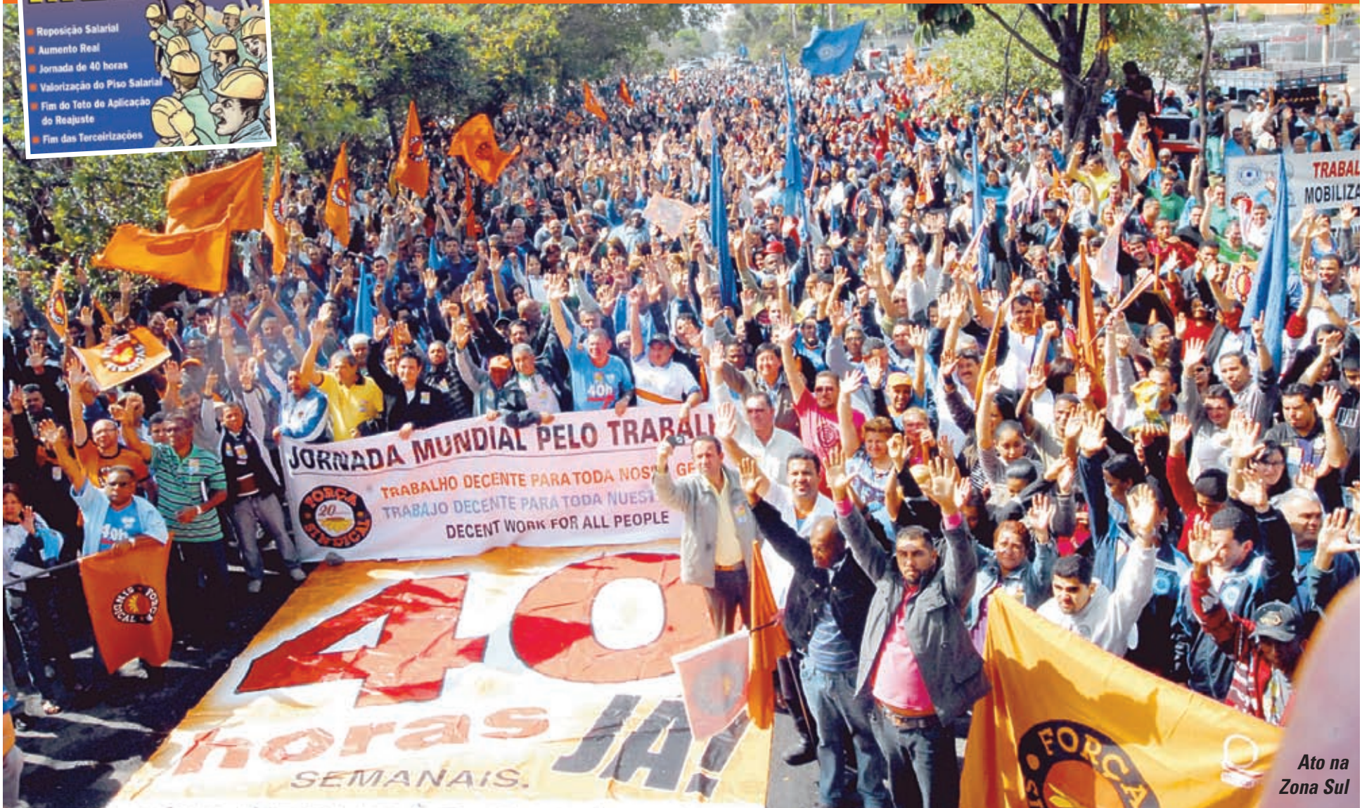
Ato na Zona Sul

Atos de mobilização nas regiões Sul e Leste reúnem mais de 15 mil trabalhadores