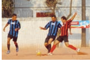
Fame X Eloy

A 3ª Copa de Futebol de Campo dos Metalúrgicos já entrou na fase decisiva. De 27 times na fase de classificação, 16 equipes conquistaram vagas nas oitavas de final, com jogos disputados nos dias 17 e 24 de setembro, e 8 times nas quartas de final, com jogos nos dias 1 e 8 de outubro. Acompanhe no site www.metalurgicos.org.br os resultados atualizados. O diretor Valdir Pereira , do Departamento de Esportes, destaca a participação dos cerca de 700 jogadores. "Disputaram com muita garra, na busca pela vitória, mas com a consciência de que o importante é competir, confraternizar-se e divertir-se", disse. O presidente do Sindicato, Miguel Torres , ressalta que um dos objetivos da Copa é integrar, proporcionar lazer à categoria e incentivar a prática de esporte e o cuidado com a saúde", disse.