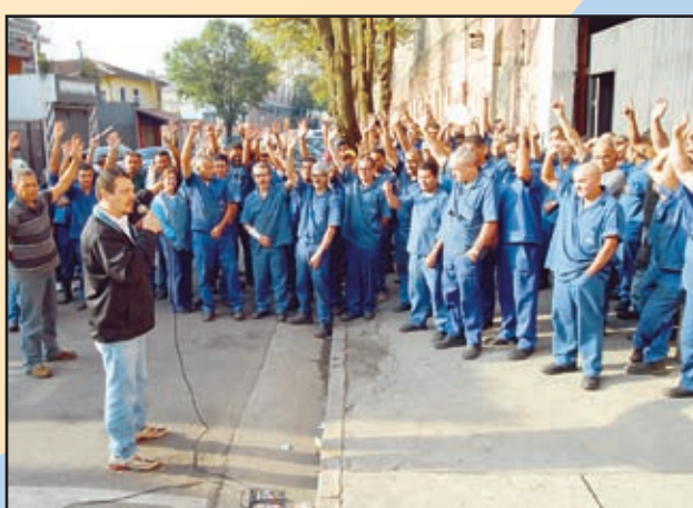
ROJEMAC PLR - Coordenador Alemão