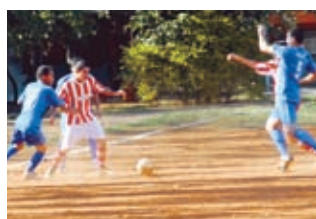
Delga X Radial Metal