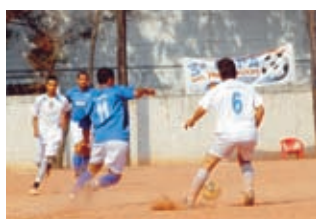
M.W.M (A) X Novex