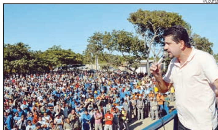
...participou, com o diretor David, das negociações pela periculosidade