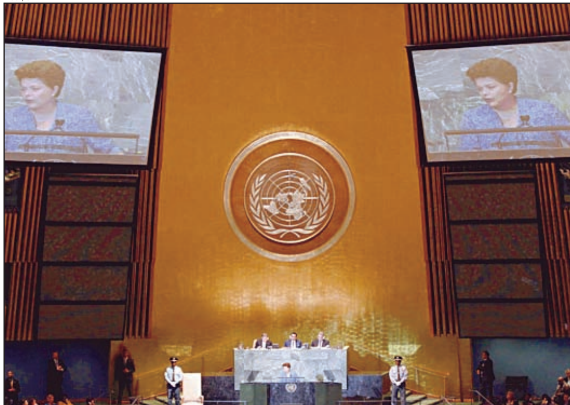
A presidente Dilma Rousseff em discurso na Assembleia-Geral da ONU

Em discurso na ONU (Organização das Nações Unidas), em setembro, a presidente Dilma Rousseff destacou a atuação da mulher na política, falou sobre crise econômica, defendeu a criação do Estado Palestino e a vaga brasileira no Conselho de Segurança da ONU.