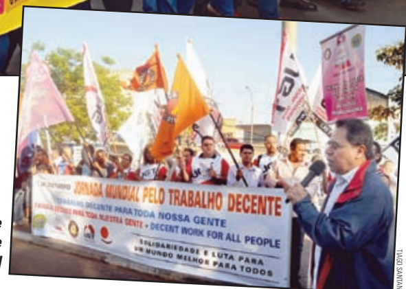
Juruna defende ação conjunta e internacional