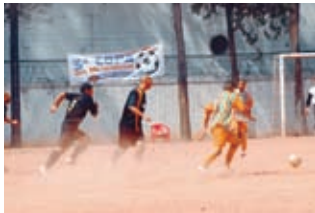
Valtra X Cartec