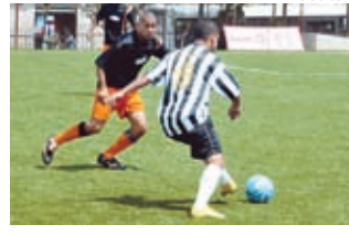
SBU Metal X Fameq