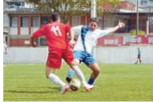
Montepino X M.W.M (B)