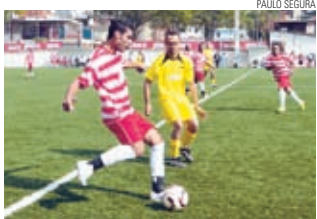
Lumini X Driveway