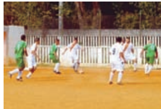
TS Shara X Prada