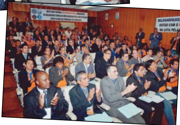
Trabalhadores no plenarinho da Câmara dos Deputados