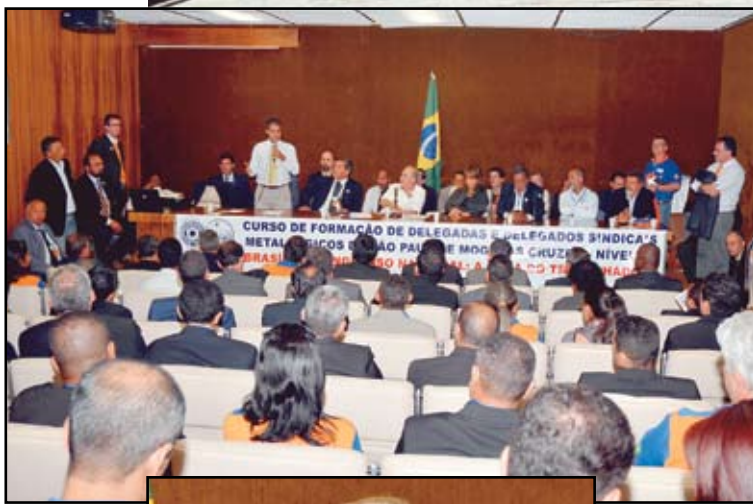
Delegados participam de palestra com consultor do Diap