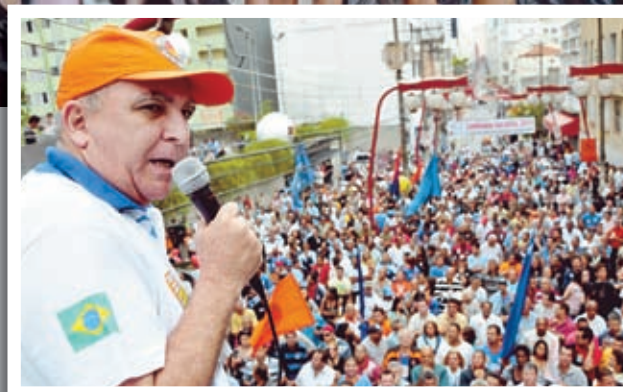
Assembleia na rua do Sindicato

"Não nos intimidamos com os discursos de que aumento de salário causa inflação e garantimos, além da reposição das perdas,