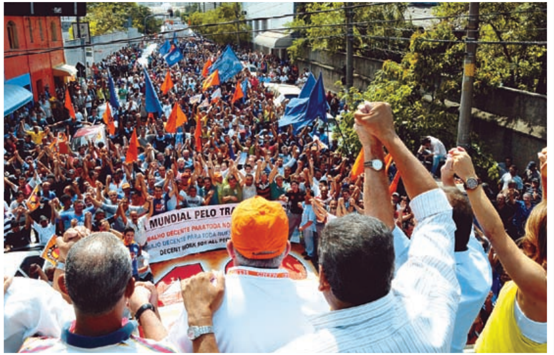
ATO NA ZONA LESTE reuniu mais de 5 mil trabalhadores das regiões leste e norte da capital