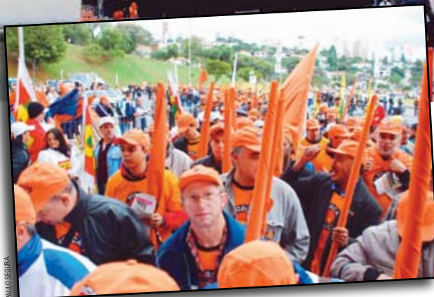
Conferência Nacional reuniu cerca de 30 mil trabalhadores no Estádio do Pacaembu

Trabalhadores e sindicalistas de todo o País aprovam a Agenda da Classe Trabalhadora, um conjunto de reivindicações que os trabalhadores desejam ver implementadas no País, e que será entregue aos candidatos à presidência da República. A Agenda, com seis eixos básicos para o desenvolvimento econômico e social, foi aprovada durante a Conferência Nacional da Classe Trabalhadora, realizada no dia 1º de junho, no estádio do Pacaembu, por cerca de 30 mil trabalhadores e sindicalistas de várias categorias profissionais, entre elas, os metalúrgicos.