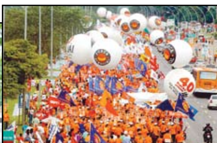
Marcha a Brasília: ação política em defesa das reivindicações dos trabalhadores