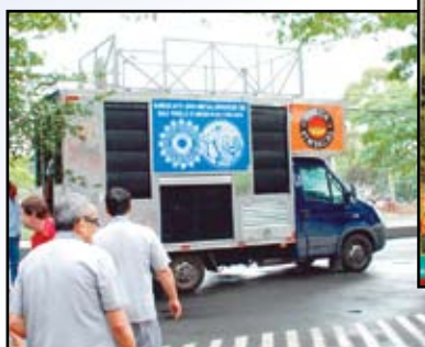
Caminhão de som utilizado em assembleias nas fábricas e ações nas ruas