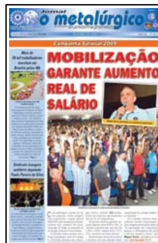
Jornal do Sindicato: recursos contribuem para o informativo da categoria