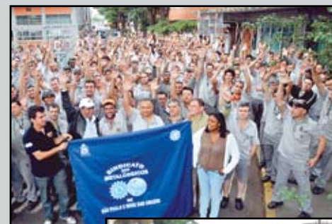
Mobilização nas fábricas